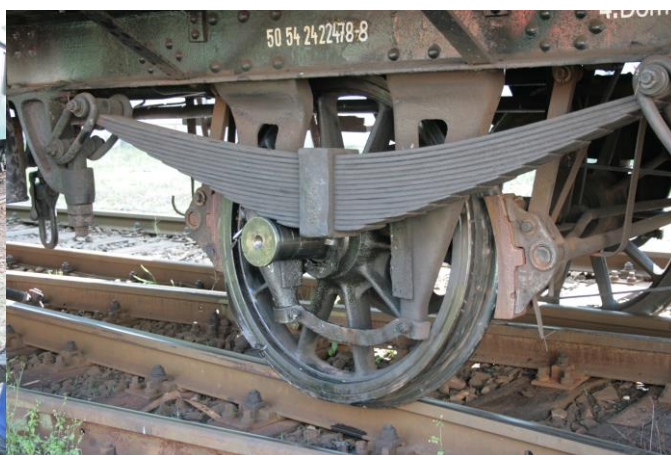
Obr. 6 Zničené úchyty nápravy a zničené kolo vagonu