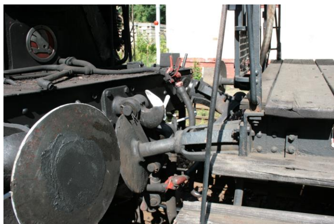
Obr. 7 Zničený nárazník vagonu