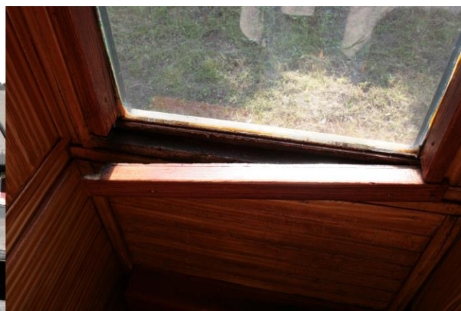
Obr. 8 Zničená konstrukce okna dokládající celkové hnutí skříně vagonu