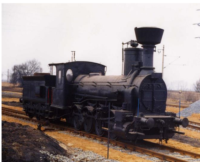
Obr. 9 Lokomotiva před zapůjčením dne 8. 2. 1992