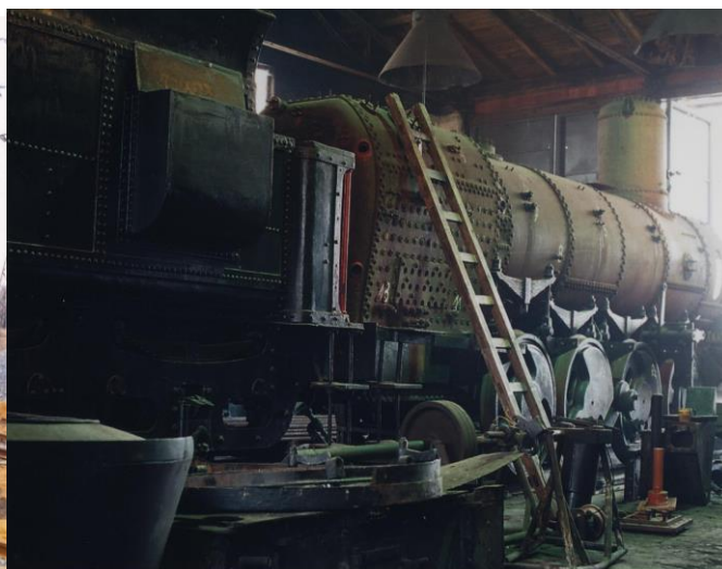
Obr. 11 Demontáž kotle lokomotivy, foto 1993