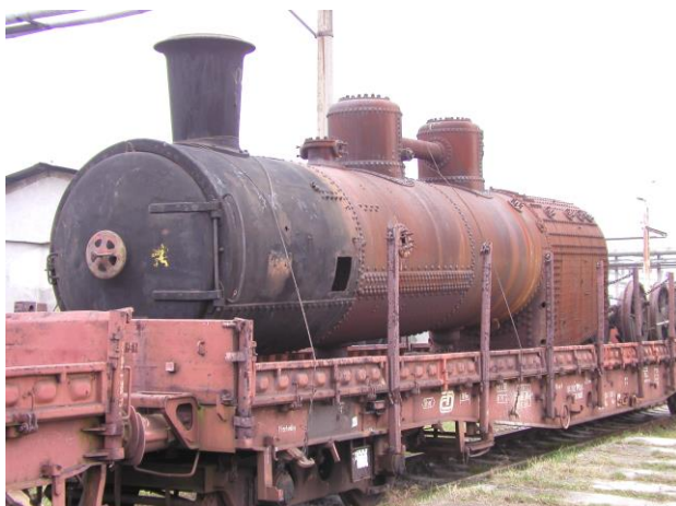
Obr. 3 Kotel lokomotivy po vrácení NTM, foto 2005