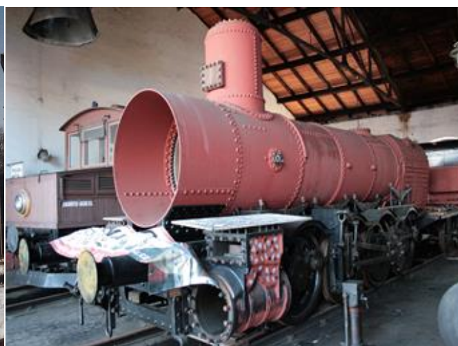
Obr. 12 Stav rozebrané lokomotivy po 21 letech, foto 2013