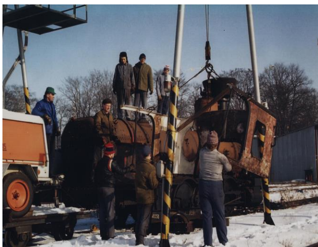
Obr. 10 Demontáž budky lokomotivy 31. 1. 1993