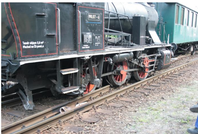
Obr. 5 Vykolejený vagon NTM je ihned za vykolejenou lokomotivou