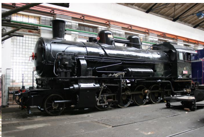
Obr. 4 Rekonstruovaná lokomotiva do původní vystavovatelného stavu, foto 2009