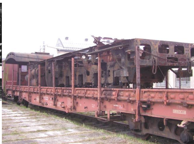
Obr. 2 Rám pojezdu lokomotivy po vrácení NTM, foto 2005